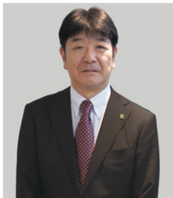
代表取締役 社長執行役員