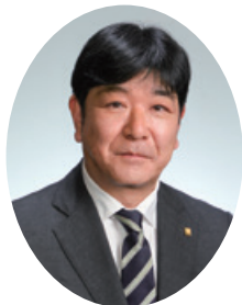
代表取締役 社長執行役員